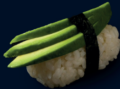
55 ●●vegan AVOCADO NIGIRI (1 Stk.) Avocado 3 €