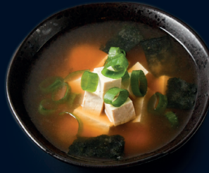
116 ● vegetarisch MISO SUPPE traditionelle japanische Suppe mit Tofu 4.4 €

Unsere Vorspeisen: Authentische und japanisch inspirierte Starter als Beilage zu deinem Sushi. Ein Geschmackserlebnis von Anfang an.