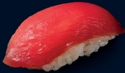
51 MAGURO NIGIRI (1 Stk.) roher Thunfisch 3.2 €