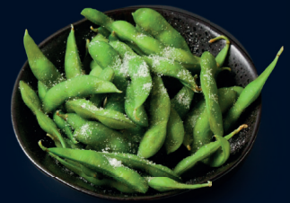
118 ●● vegan EDAMAME japanische Sojabohnen gekocht und gesalzen 5.8 €