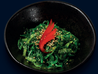
120 ●● vegan WAKAME SALAT würziger Seetang Salat mit Sesam 4.9 €