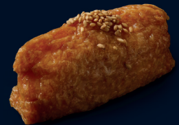
57 ●●vegan INARI NIGIRI (1 Stk.) gesüßte Tofutasche gefüllt mit Sushi-Reis und weißem Sesam 3 €