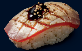
53 MAGURO NIGIRI FLAMBIERT (1 Stk.) flambierter Thunfisch, weißer Sesam mit hausgemachter Teriyaki Sauce 3.5 €