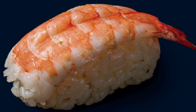
54 EBI NIGIRI (1 Stk.) Garnele 3.1 €