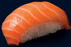
50 SAKE NIGIRI roher Lachs 2.8 €