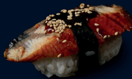
56 UNAGI NIGIRI (1 Stk.) marinierter gegrillter Aal mit Teriyaki Sauce 3.3 €