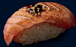
52 SAKE NIGIRI FLAMBIERT (1 Stk.) flambierter Lachs, weißer Sesam mit hausgemachter Teriyaki Sauce 3.1 €