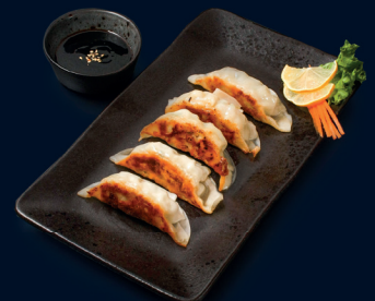
117 GYOZA (5 Stk.) fünf gedämpfte Teigtaschen mit Hähnchen, Gemüse und hausgemachter Teriyaki Sauce 6.2 €