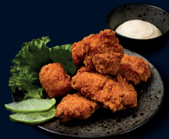
119 KAARAGE (4 Stk.) vier Stücke knusprig frittiertes und herzhaft mariniertes saftiges Hähnchen nach japanischer Art mit japanischer Mayonnaise 6.8 €