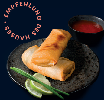
115 ● vegetarisch FRÜHLINGSROLLEN (2 Stk.) zwei handgerollte Frühlingsrollen mit Sweet-Chilli Sauce 6.4 €